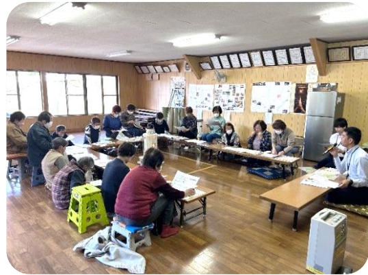
乗り方教室の様子（東山1）