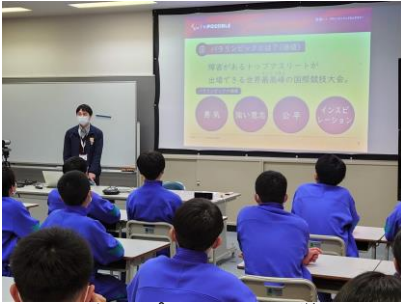
パラスポーツについて学ぶ

体育館での「ボッチャ」体験で、生徒は4つのコートに分かれて対戦をおこないました。その中で、「視覚障がい体験ゴーグル」を着用したり「車いす」を使ったりしながら、障がいをもつ人の立場で「ボッチャ」の体験することによって、パラスポーツへの理解を深めることができました。