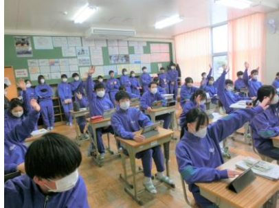
2年A組・社会科授業