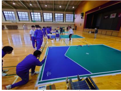
ボッチャを体験する