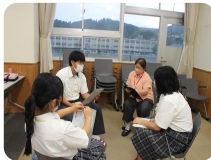
R5.9.8～コミュニケーション講座