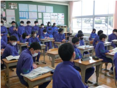
1年A組・英語科授業

2月29日(木)第4校時には、1・2年生が公開した授業を3年生が参観しました。授業後には、卒業を間近に控える3年生から、「反応がよく、活発な交流ができていた。」「詳しい説明を付け加えた発言があって、よかった。」などの感想やアドバイスが寄せられました。これを受け、1・2年生が更なる高みを目指して、授業に磨きをかけていくことを期待しています。