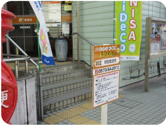
新たに設置された「デマンド交通よやくる号」のバス停（明智郵便局）