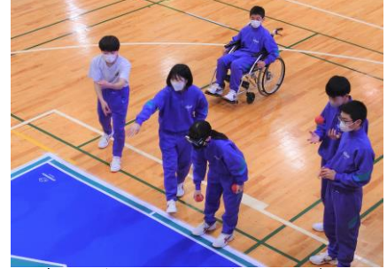
障がいをもつ人の立場になって考える