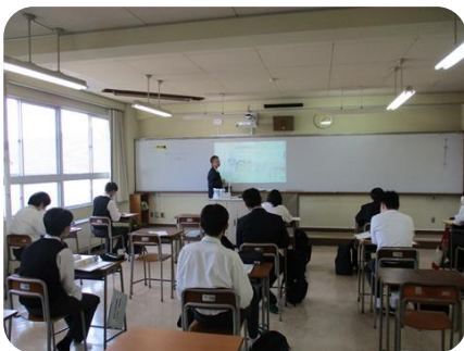
R5.5.15～前期授業公開週間見学

今年度も地域のまちづくり活動に生徒が積極的に参加できるよう学校との連携を取ってまいります。