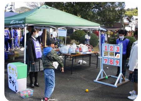
R5.11.19 かえでまつり（こどもひろば）