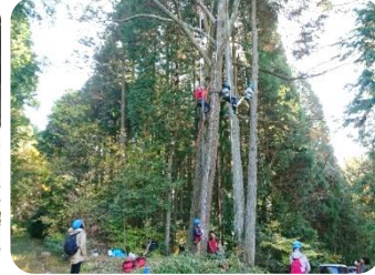
ツリークライミング