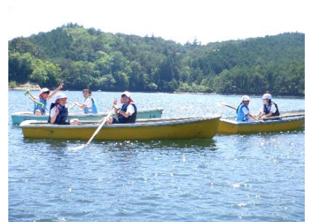
根の上高原・ボート体験