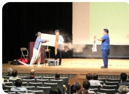
火災警報器作動体験