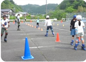
インラインスケート