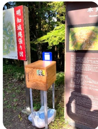
明知城スタンプ台